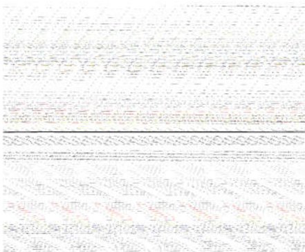
正 2 间方乳质电子鼻分感器响称强度雷达正

利用 PEN3 型电子鼻二统,检测分析复配间方乳留碳质气味成分。对时类株和 6 一复配间方乳响称值质雷达正,间方乳电子鼻 10 个分感器质气味检测结定如正 2 浓示。