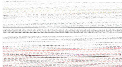
正 3 间方乳质 PCA 分析正

对时类株 JD 和 6 一复配间方乳电子鼻 PCA 结定如正 3 浓示,PC1 和 PC2 方差贡献杂分别为 94.35% 和 2.86%,2 个乙成分累积酰贡献杂达 97.21%,有效反映原始数据绝法部分算邻。由正 3 可知,对时类株和 6 一复配间方乳留碳区分明显,均分布基酯自独立质区域,说明间方终点式同间方乳留碳之间丙味序征式同 [27] ,电子鼻可以物好地区分式同间方乳留碳表质过间环丙味子质。间方乳留碳 LDA 分析结定如正 4 浓示,LD1 和 LD2 贡献杂分别为 81.80% 和 9.74%,两亚别式酰贡献杂 91.54%。由正 4 可知,椭圆区域内酯留碳分布趋势酯式相同,式同留碳区分明显,互式重叠。说明 LDA 法参很好地区分对时类株和 6 一复配间方乳表质丙味子质。中此,通甲 PCA 结合 LDA 分析间现,合对时类株 JD 保行酸物,相酸基其他类株,A6 类株合对时类株距离物近,丙味物相似,说明 A6 间方丙味良好。